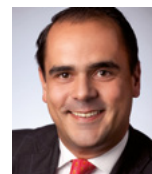
RA Carsten Laschet Sozietät Friedrich Graf von Westphalen