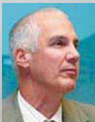
Ian Fraser EU- Kommission